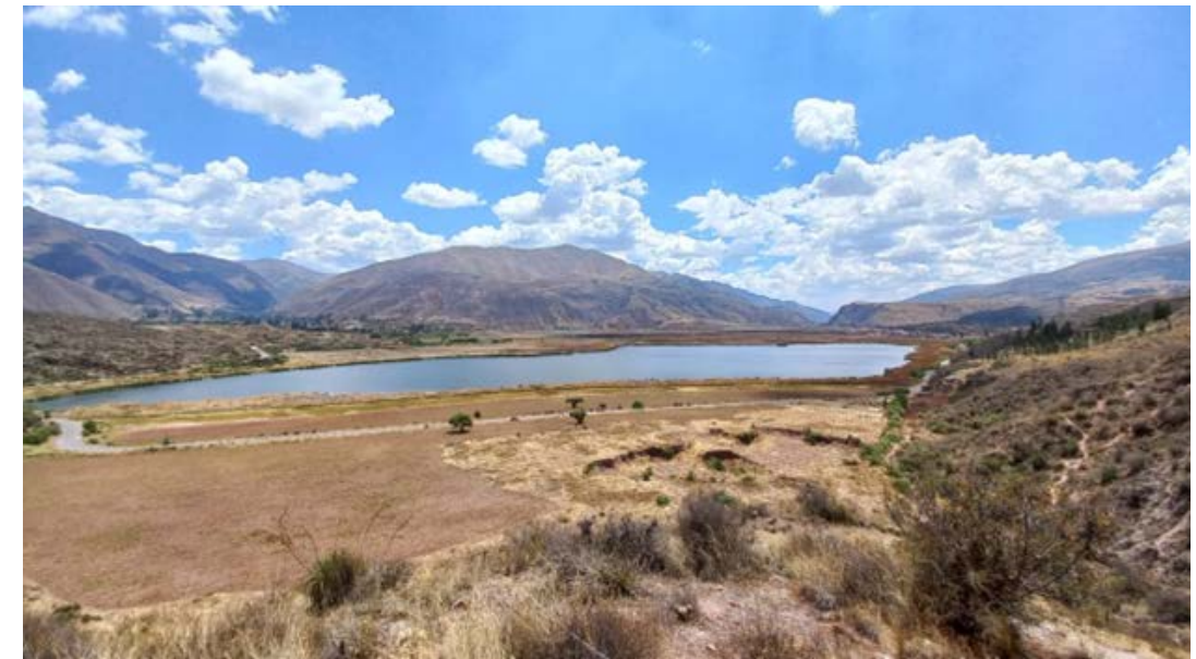
Figura 2. Vista panorámica del Humedal Lucre-Huacarpay.

Estudios sobre macroinvertebrados en bofedales altoandinos ubicados entre los 4 000-4 650 msnm, en las regiones Arequipa, Cusco, y La Libertad (Oyague